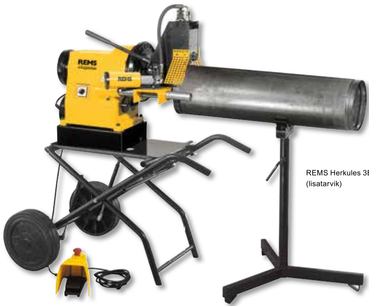
REMS Herkules 3B (lisatarvik)