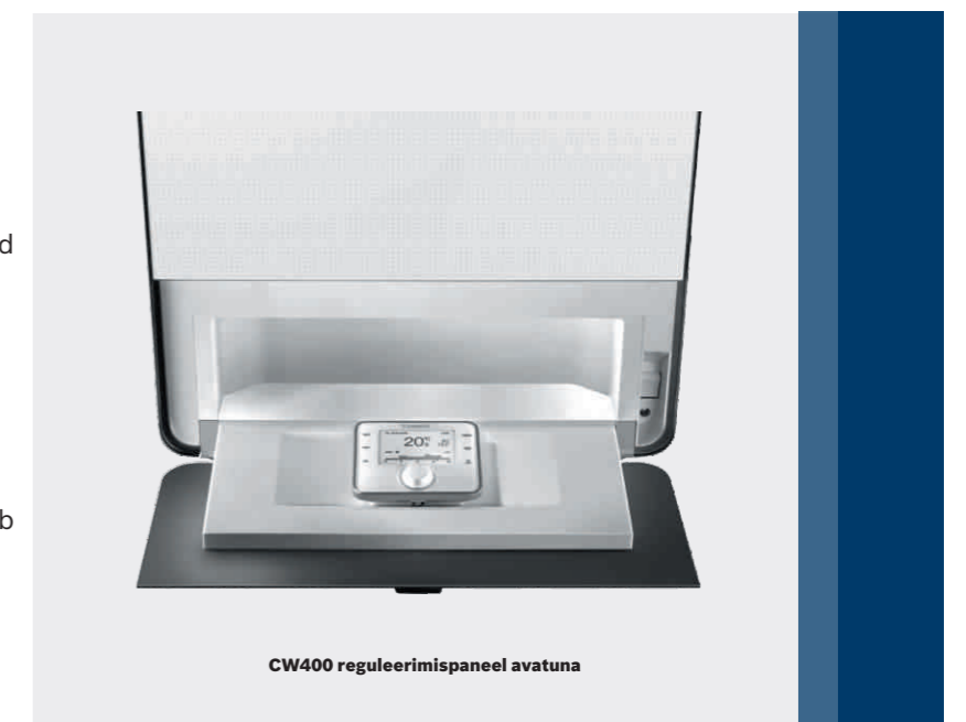
CW400 reguleerimispaneel avatuna

Uuendusliku mitmest osast koosneva regulaatori abil saab puuetundliku ekraani kaudu mugavalt juhtida kütte põhifunktsioone. Kui regulaatori paneel avada, saab CW400 regulaatori abil täiendavate funktsioonide juhtimist alustada ühe nupuvajutusega.